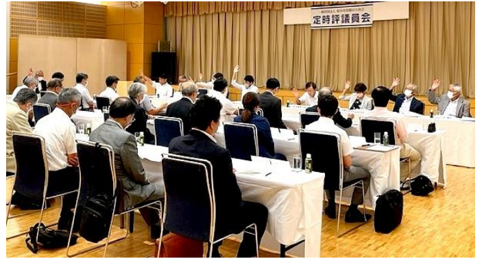
定時評議員会(6月20日開催)