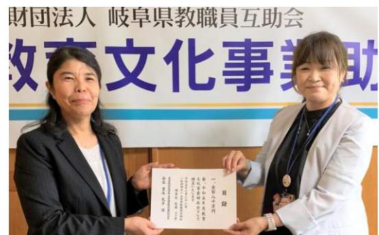
《本年度助成金贈呈式より》

岐阜県特別支援学校教育研究会、岐阜県小中学校教育研究会、岐阜県高等学校教育研究会、岐阜県事務職員研究会等をはじめ、教育関係の東海・全国の各種研究大会等、現職の教職員の皆様に関係する団体にも多く助成しています。